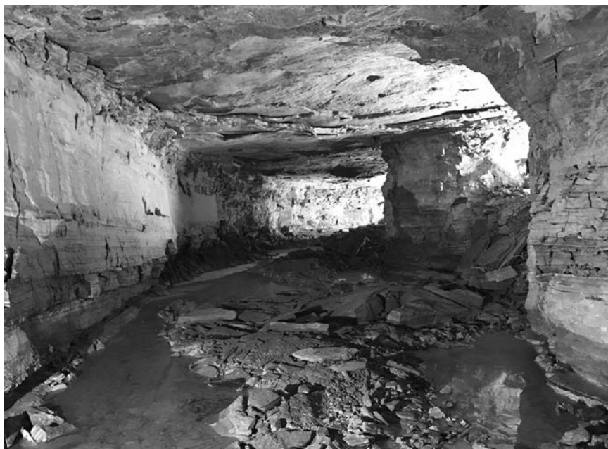
Gipsmuseum Schleithem, www.museum-schleithem.ch