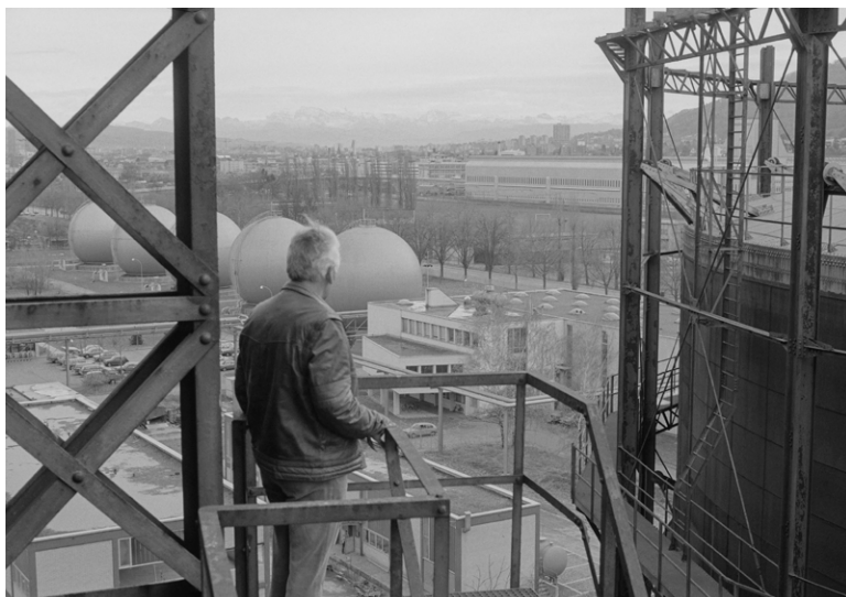
Gaswerk, Schlieren, Heinz Baumann 1984, e-pics.ethz.ch